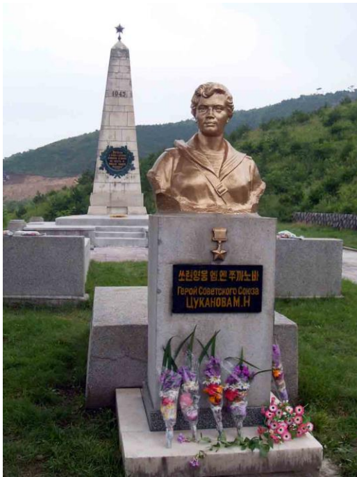
Памятник Герою Советского Союза Цукановой М.Н.