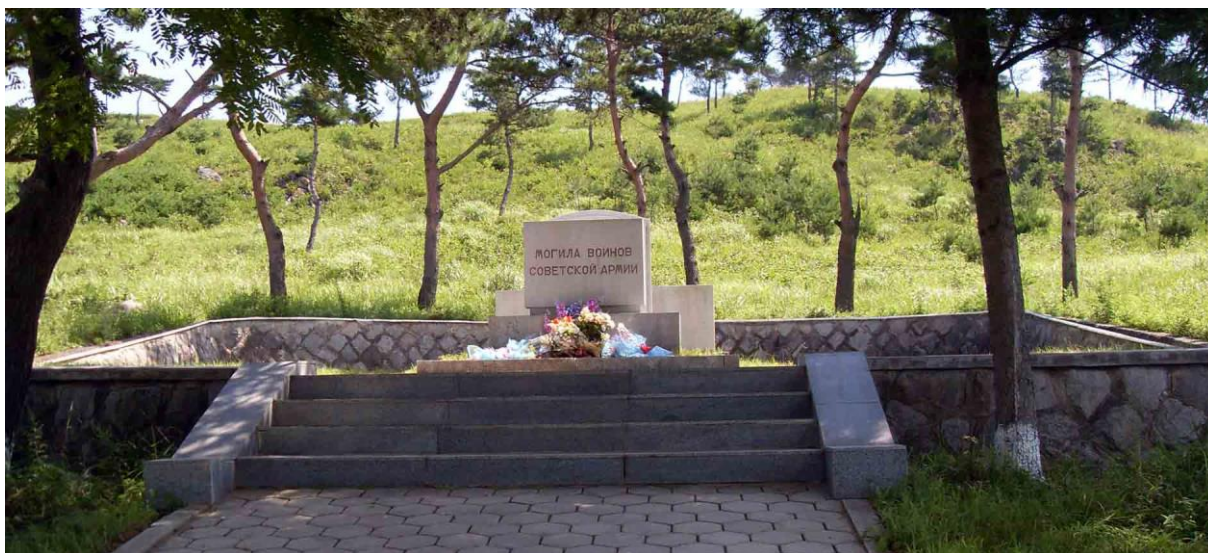
Общий вид мемориала со стороны входа