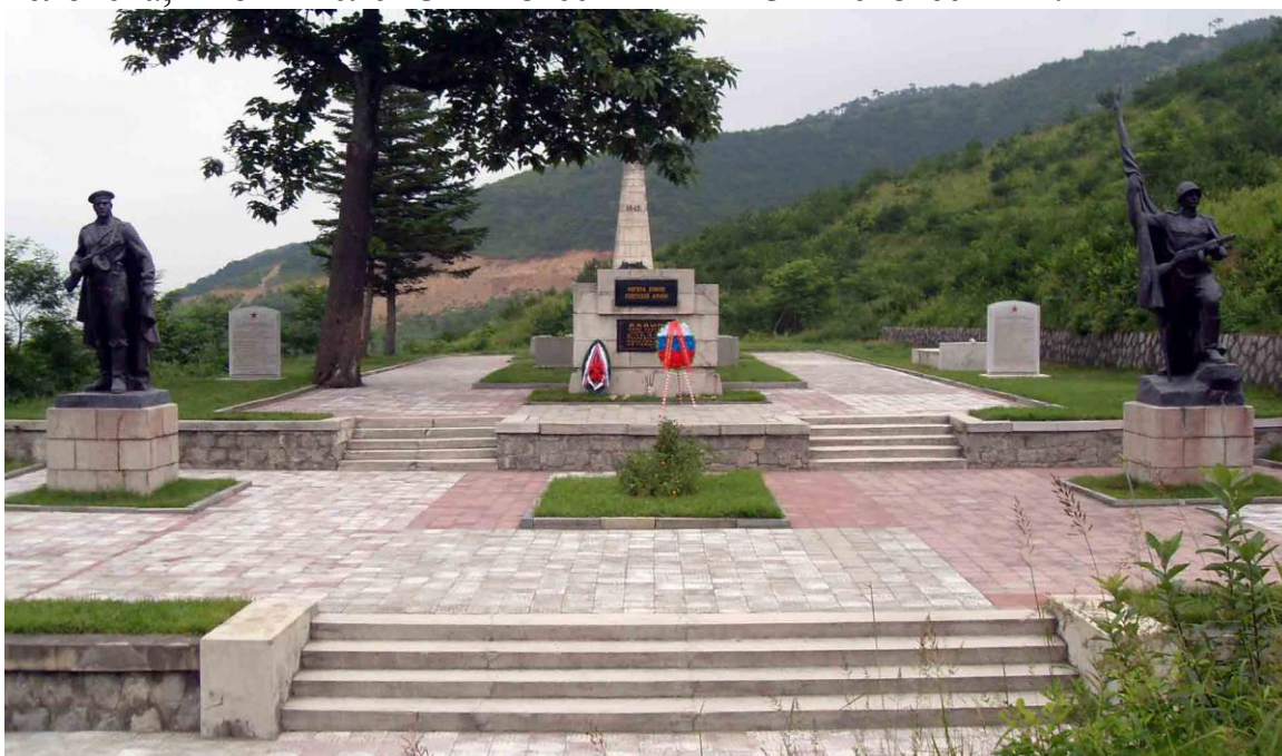
Общий вид Мемориала со стороны входа.

По Учётной карточке воинских захоронений № 3 от 15.11.2010 г., подписанной военным, военно-воздушным и военно-морским атташе при Посольстве РФ в КНДР полковником А. Бартусовым, на Мемориале захоронено 375 человека, в том числе 232 - известных и 143 – неизвестных.