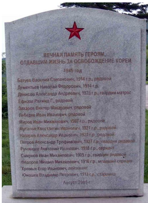
Левая мемориальная плита. Установлена в 2005 г.