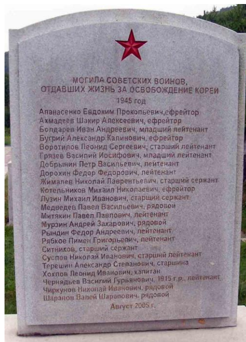
Правая мемориальная плита. Установлена в 2005 г.

Всего захоронено 375 военнослужащих 共埋葬有375名军人