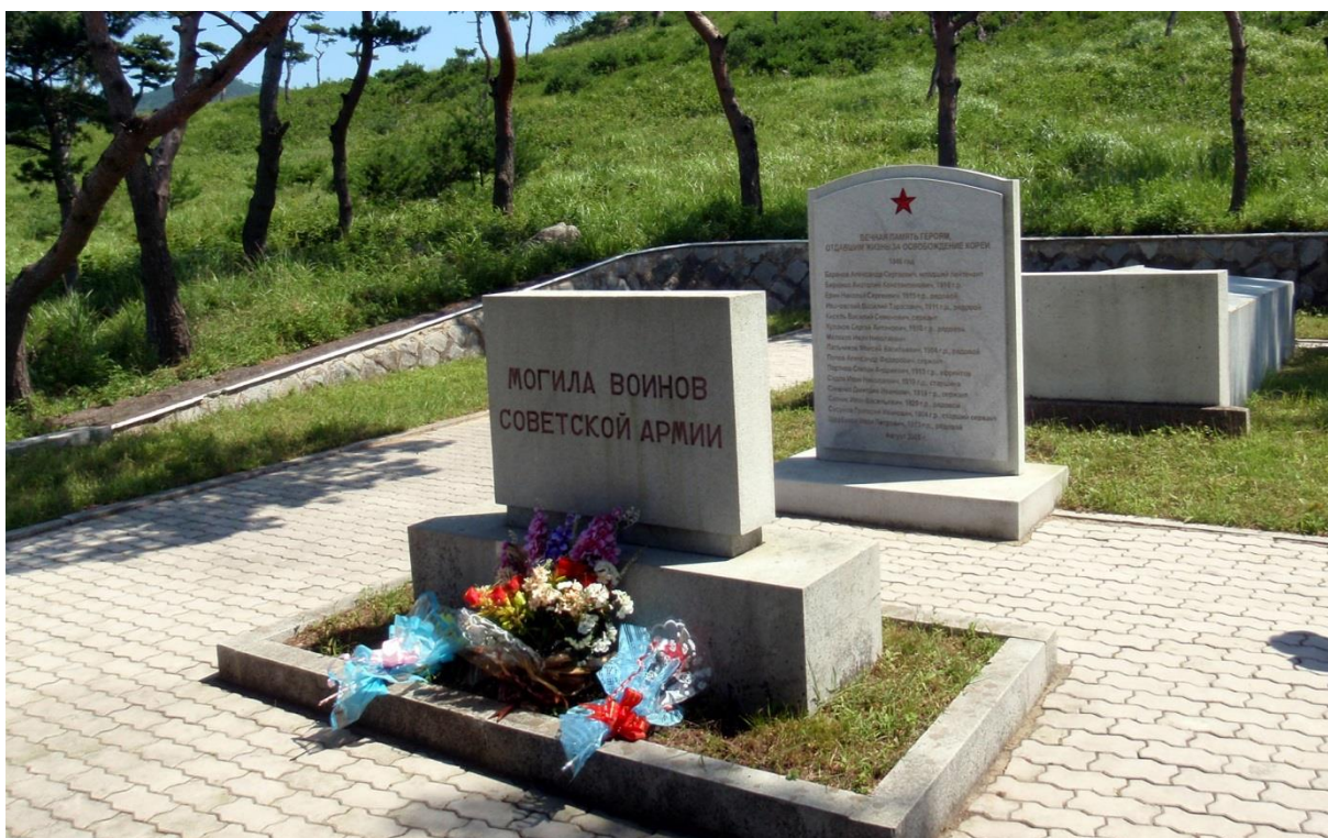
Общий вид справа от входа

В августе 2005 г. Посольством РФ в КНДР на мемориале была установлена дополнительная мемориальная плита. На плите указаны фамилии ещё 15 погибших военнослужащих (фото справа).