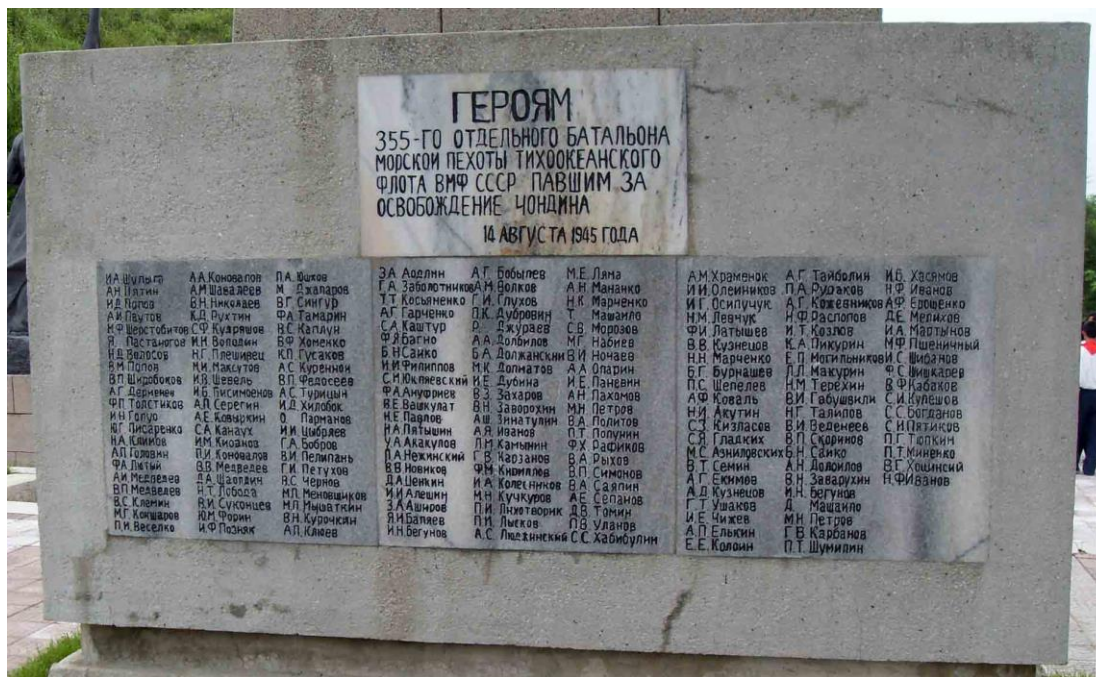
Центральная мемориальная плита.