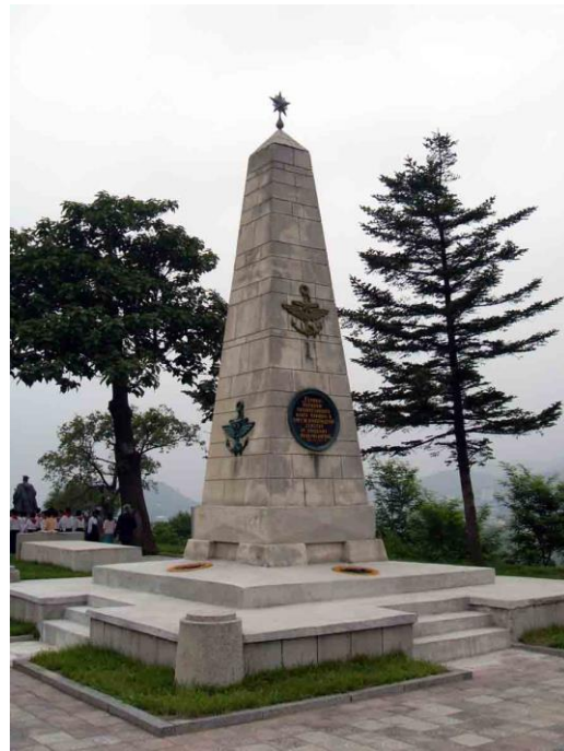
Обелиск с тыльной части Мемориала, Вид с внешней стороны.