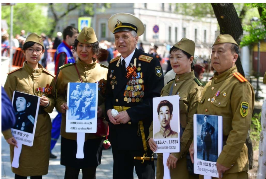
Рис 2. Председатель Совета ветеранов г. Владивостока с потомками китайских ветеранов 88-й бригады. 9 мая 2018 года.