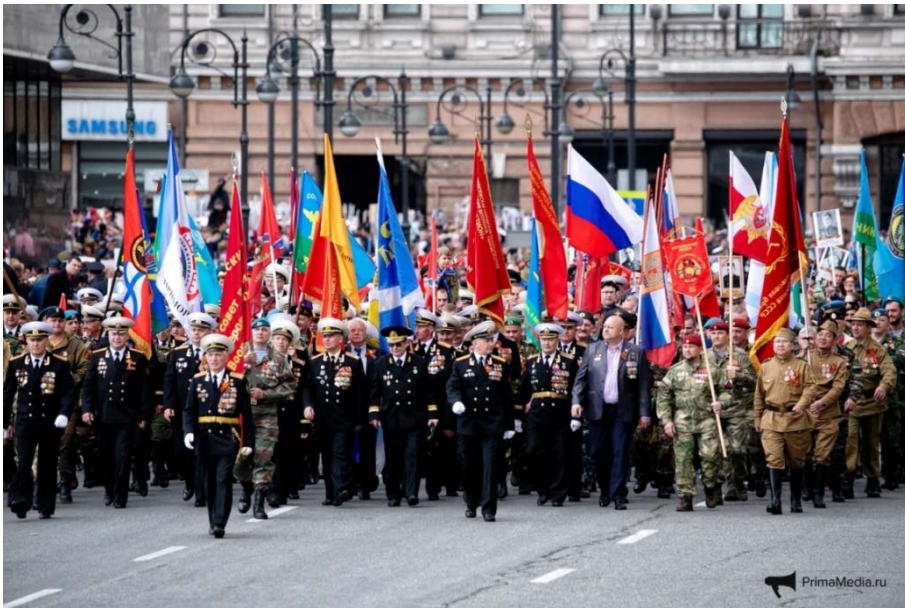
Рис 3. Праздничное шествие в День Победы на центральной улице Владивостока.