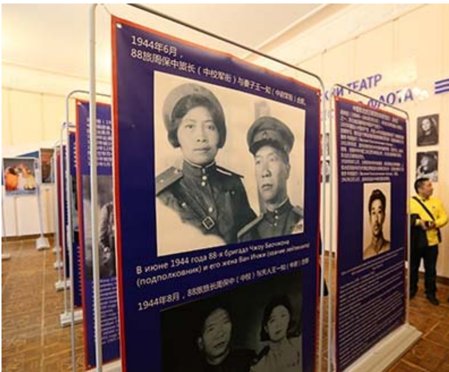
Рис 4. Фотовыставка, посвященная боевому пути 88-й бригады, в помещении Дома офицеров ТОФ.

С 2016 г. делегация мэрии Владивостока 3 сентября участвует в Харбине в мероприятиях, посвященных окончанию Второй мировой войны. Их организует Русский клуб в Харбине при поддержке Генерального консульства России и при участии Канцелярии иностранных дел города. В составе делегации четыре раза в столицу провинции Хэйлунцзян приезжал председатель Совета ветеранов города Владивостока, полковник в отставке