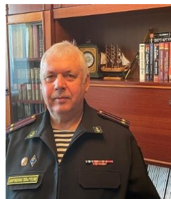
Публикацию подготовил Валентин Ковальчук. Председатель Артёмовского местного отделения Приморского краевого отделения Русского географического общества - Общества изучения Амурского края. Март 2024 г.