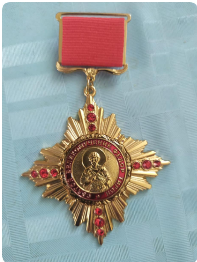
Медаль «Святого Великомученика Феодора Тирона» Пинской епархии.

«Велия веры исправления, во источнице пламене, яко на воде упокоения, святой мученик Феодор радовавшеся, огнём бо всесожжется, яко хлеб сладкий Троице принесется.