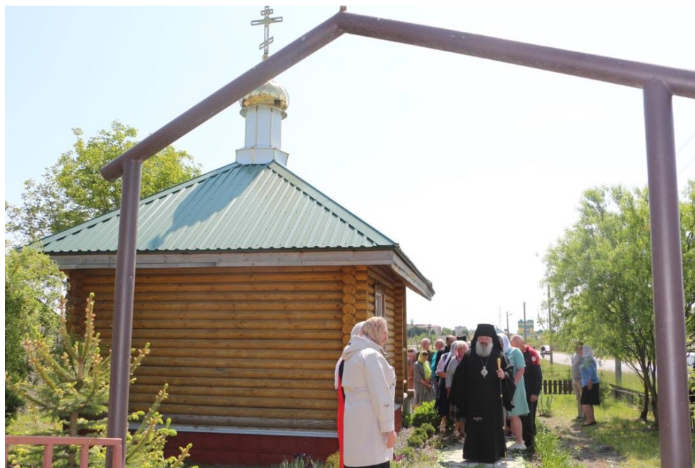
Часовня в д. Холопья Ивацевичского района Брестской области имени святителя Николая Чудотворца . 29.05.2023 г.