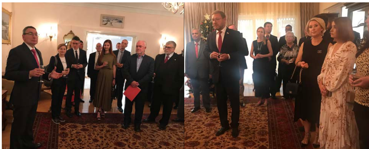
Прием в посольстве России в Канберре, 14 января 2020 г.

В составе делегации Совета Федерации в Канберру прибыли Председатель комитета Совета Федерации по международным делам Константин Иосифович Косачев, первый заместитель председателя Комитета Совета Федерации по конституционному законодательству и государственному строительству Людмила Николаевна Бокова и заместитель председателя комитета СФ по международным делам Андрей Аркадьевич Климов.