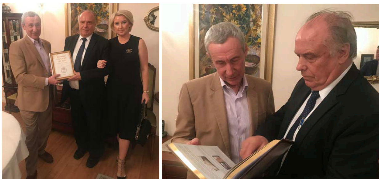
Сенатор А.А. Климов, М.М. Овчинников, О.Е. Овчинникова посольство России в Канберре, 14 января 2020 г.

Он обратился за поддержкой и содействием в вопросе передачи Церкви всего комплекса монастырских зданий на Черемшане и в возрождении этой духовной святыни на Саратовской земле.