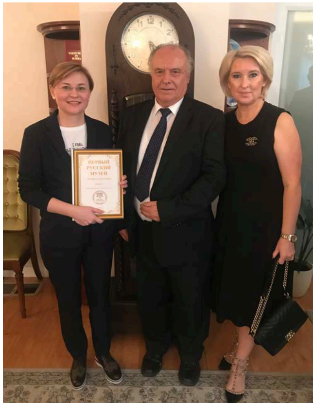
Сенатор Л.Н. Бокова, М.М. Овчинников, О.Е. Овчинникова, посольство России в Канберре, 14 января 2020 г.

В разговоре с сенатором Л. Боковой, которая является членом Совета Федерации от Саратовской области, М. Овчинников рассказал о восстановлении старообрядческого Черемшанского монастыря.