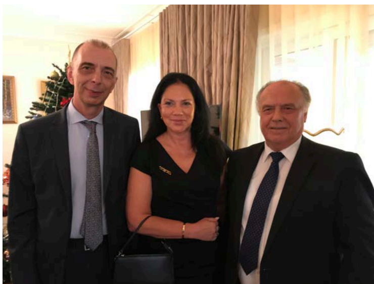
Генеральный консул И.Н. Аржаев, почетный генеральный консул И. Брук, М.М. Овчинников, посольство России в Канберре, 14 января 2020 г.

На приеме присутствовали генеральный консул России в Сиднее И.Н. Аржаев, советник президента России по Азиатско-Тихоокеанскому региону Григорий Семенович Логвинов с супругой Ириной Николаевной, почетный консул в Квинсленде и Виктории Ирина Брук, дипломаты и представители государств-участниц Азиатско-Тихоокеанского парламентского форума, деятели общины российских соотечественников в Сиднее и другие лица.