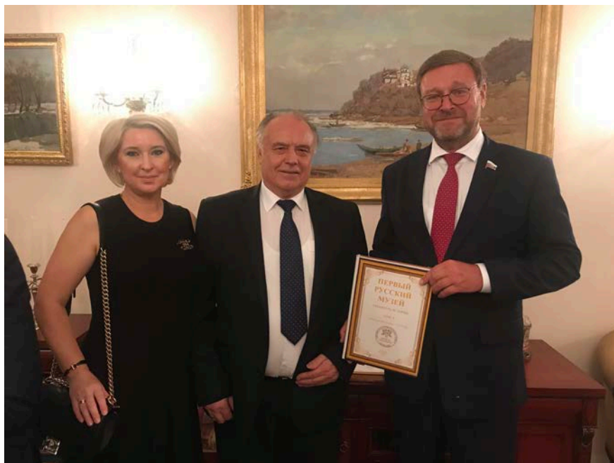
О.Е. Овчинникова, М.М. Овчинников, сенатор К.И. Косачев, посольство России в Канберре, 14 января 2020 г.

В ходе приема была возможность встретиться и поговорить с Российскими сенаторами.