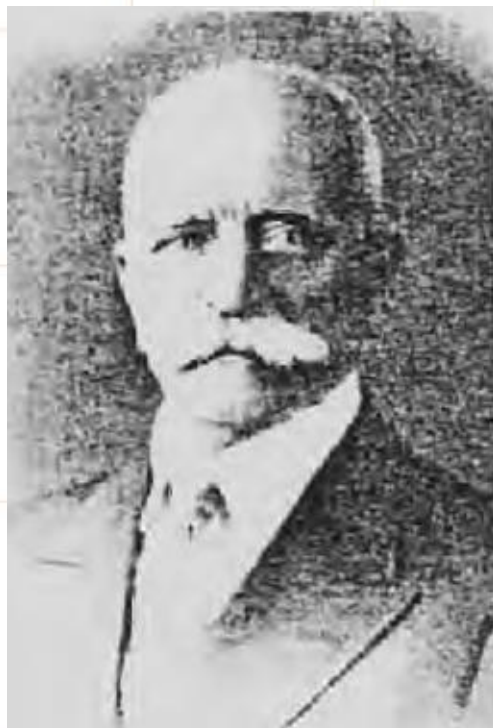
Фото из «Харбинский синодик XX века. Духовенство и церковные деятели. / Составители А.Г. Щегольков, А.В. Косарев. -- Челябинск, 2009. — 348 с. Издание второе подготовительное.

Фото: сайт Российское зарубежье. Некрологи. Чуваков Вадим Никитич (составитель) Незабытые могилы. Издательство: Москва: „Пашков дом“ Том 1