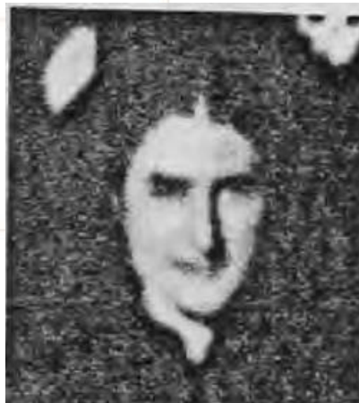
Фото из «Харбинский синодик XX века. Духовенство и церковные деятели.