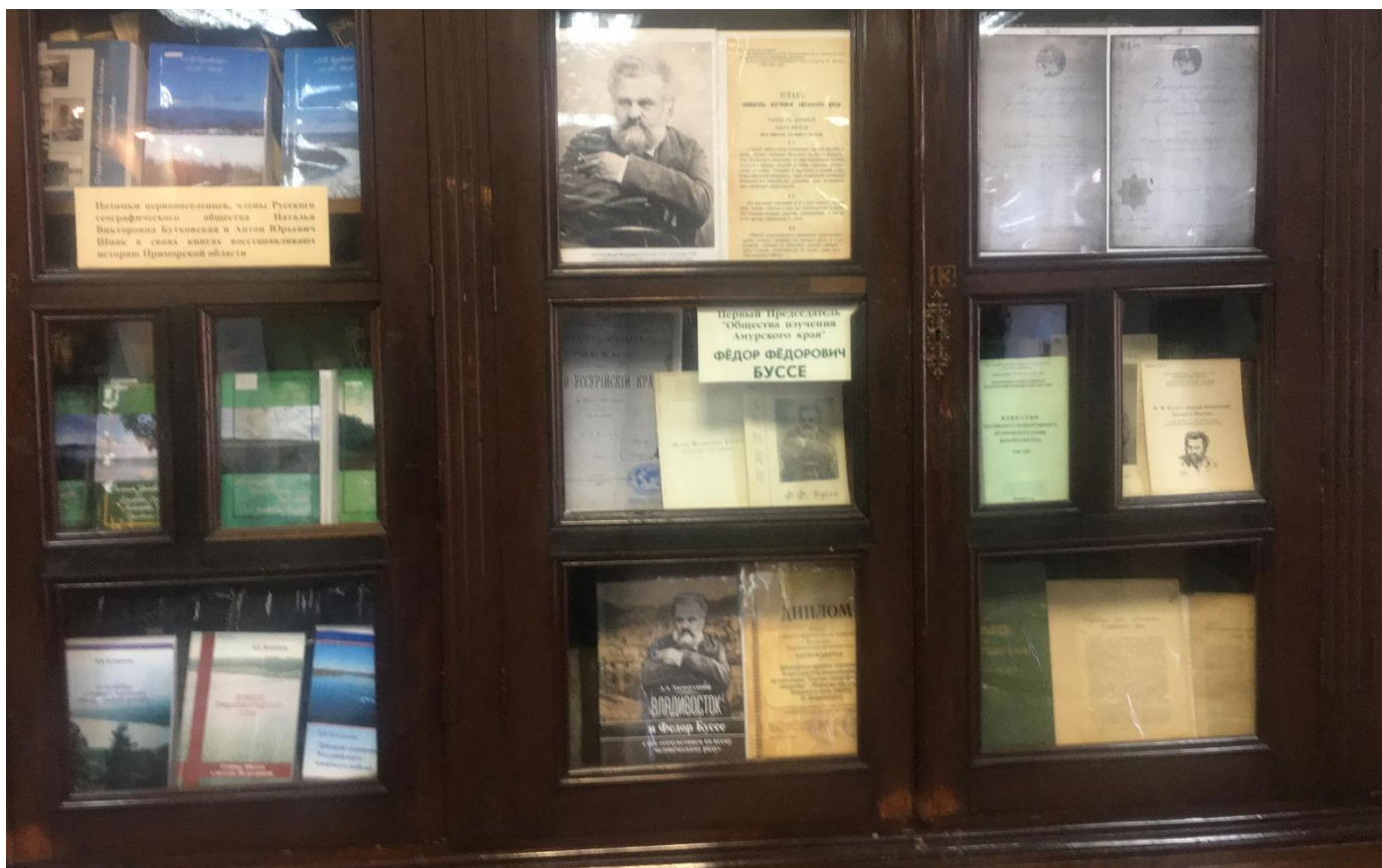
Выставка редких книг, посвящённых одному из первых основателей Общества Ф.Ф. Буссе.