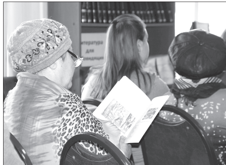
Некоторые слушатели пришли с книгами ученого, в надежде получить автограф