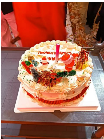
Рис. 4. Новогодний торт.

Со своей стороны, российские туристы делились своими праздничными традициями, такими как резать торт, поднимать тост под бой курантов и произносить сердечные добрые пожелания. Объединяющим моментом, стирающим границы, стали совместные веселые катания на снежных горках – универсальный язык радости и детства, понятный без перевода. Совместное пение на двух языках «Подмосковных вечеров» и «Катюши» стало признаком зарождения еще одной, на этот раз русско-китайской традиции. Возникший из совместного действия микрокосм праздника наглядно продемонстрировал, как личное участие закладывает прочный фундамент межгосударственных отношений.