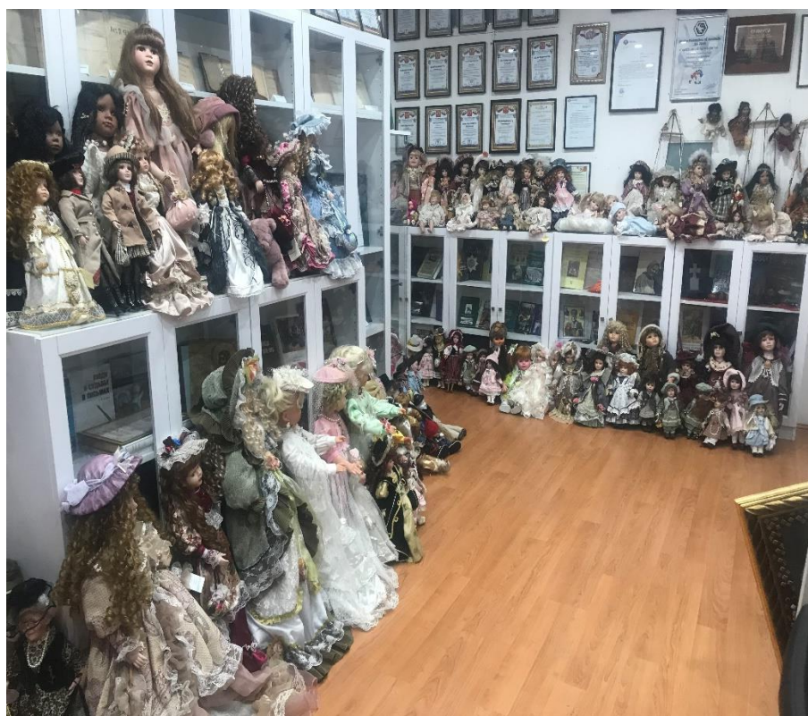
Коллекция кукол переданная в дар Первому Русскому Музею в Австралии