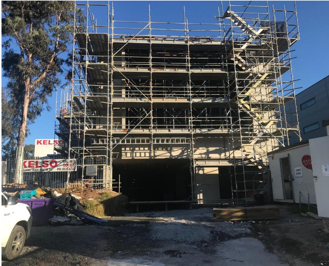
Строительство нового здания для 1-ого Русского Музея в Австралии

Я уверен, что на сегодняшний день аналога подобного Музея в Австралии нет, как нет и подобных меценатов, как Овчинников Михаил Моисеевич, готовых не только вкладывать свои личные средства в строительство нового здания Первого Русского Музея в Австралии, но и тратить при этом бесценные годы своей жизни для сохранения русской культуры, как основы и фундамента, без которого русский человек перестанет осознавать себя русским. Я считаю, что люди, которые имеют предметы русской культуры и хотят сохранить их для наших потомков поступят правильно, передав на хранение в Ваш Музей.